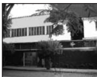
Centro Espirita Léon Denis (CELD)

Participe desta causa e ajude o CELD a manter suas Obras Sociais