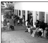
Obra Social Antonio de Aquino