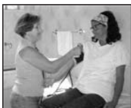
Atendimento na OSAA