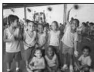
Creche Maria de Nazaré