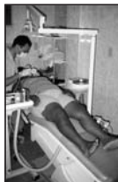
Atendimento na OSAA