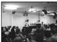
Dia de Reunião Pública no CELD